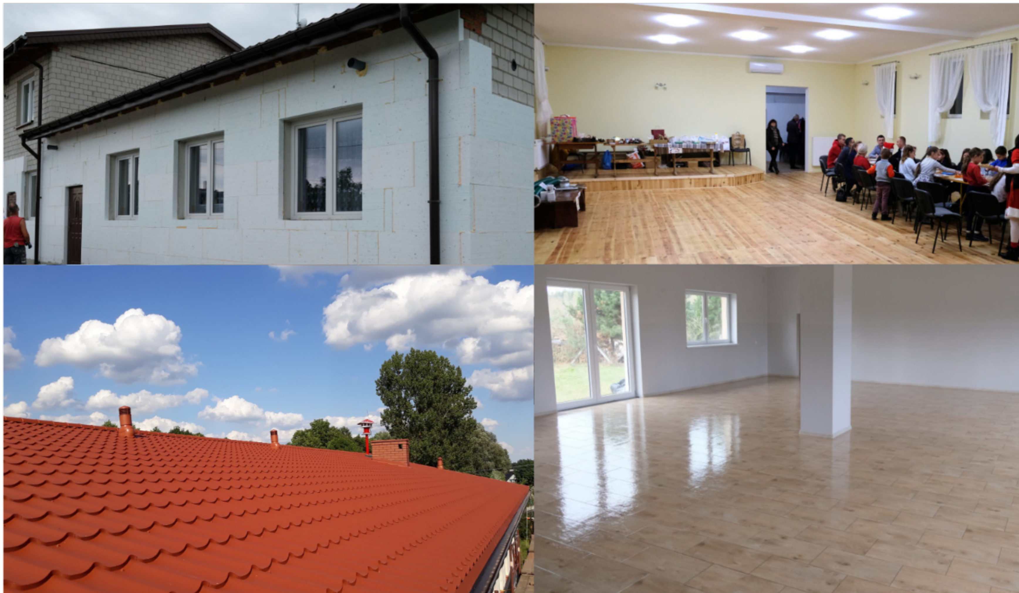
Remonty sal i świetlic wiejskich