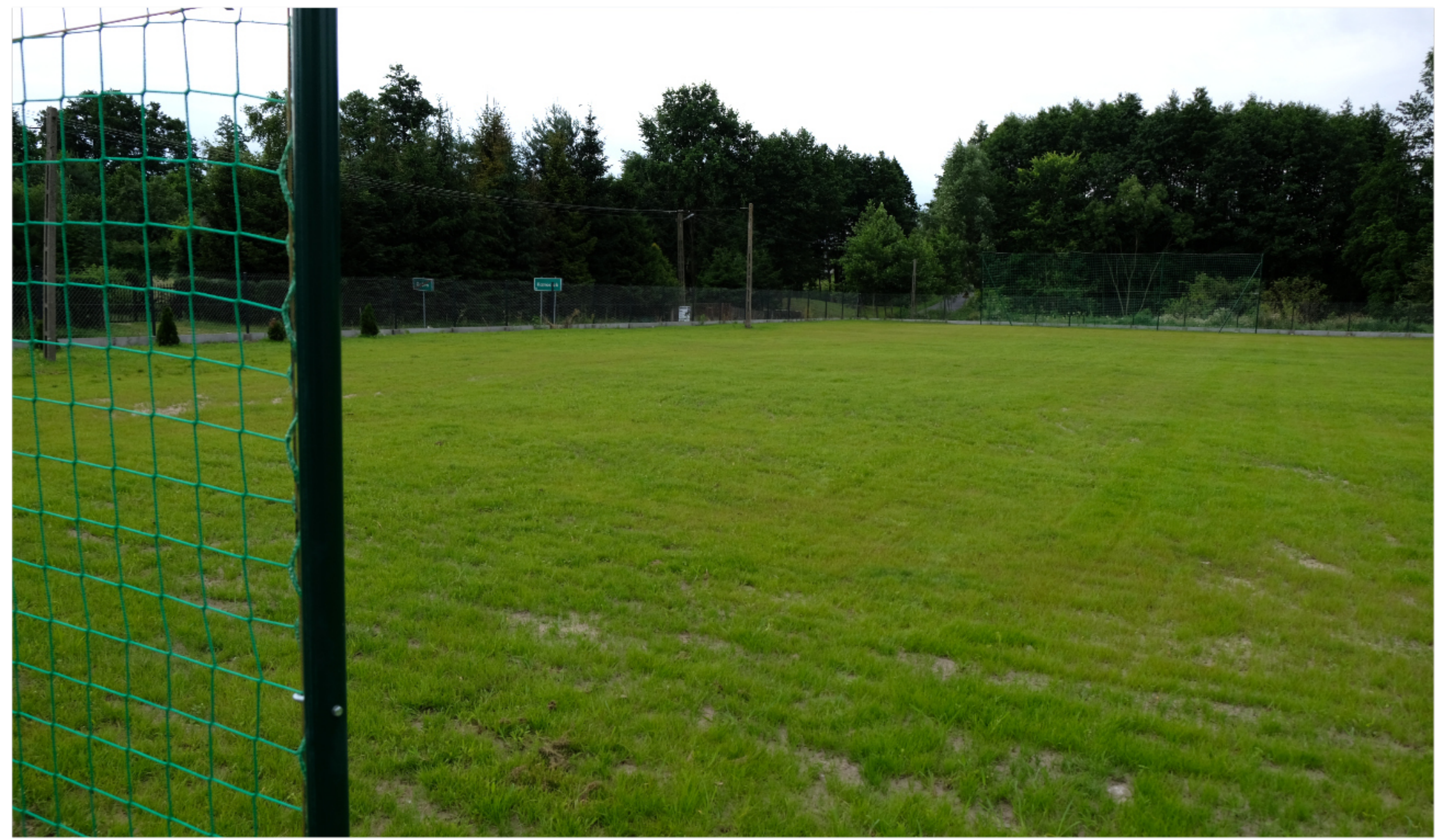
Nowe boisko w Dobrej