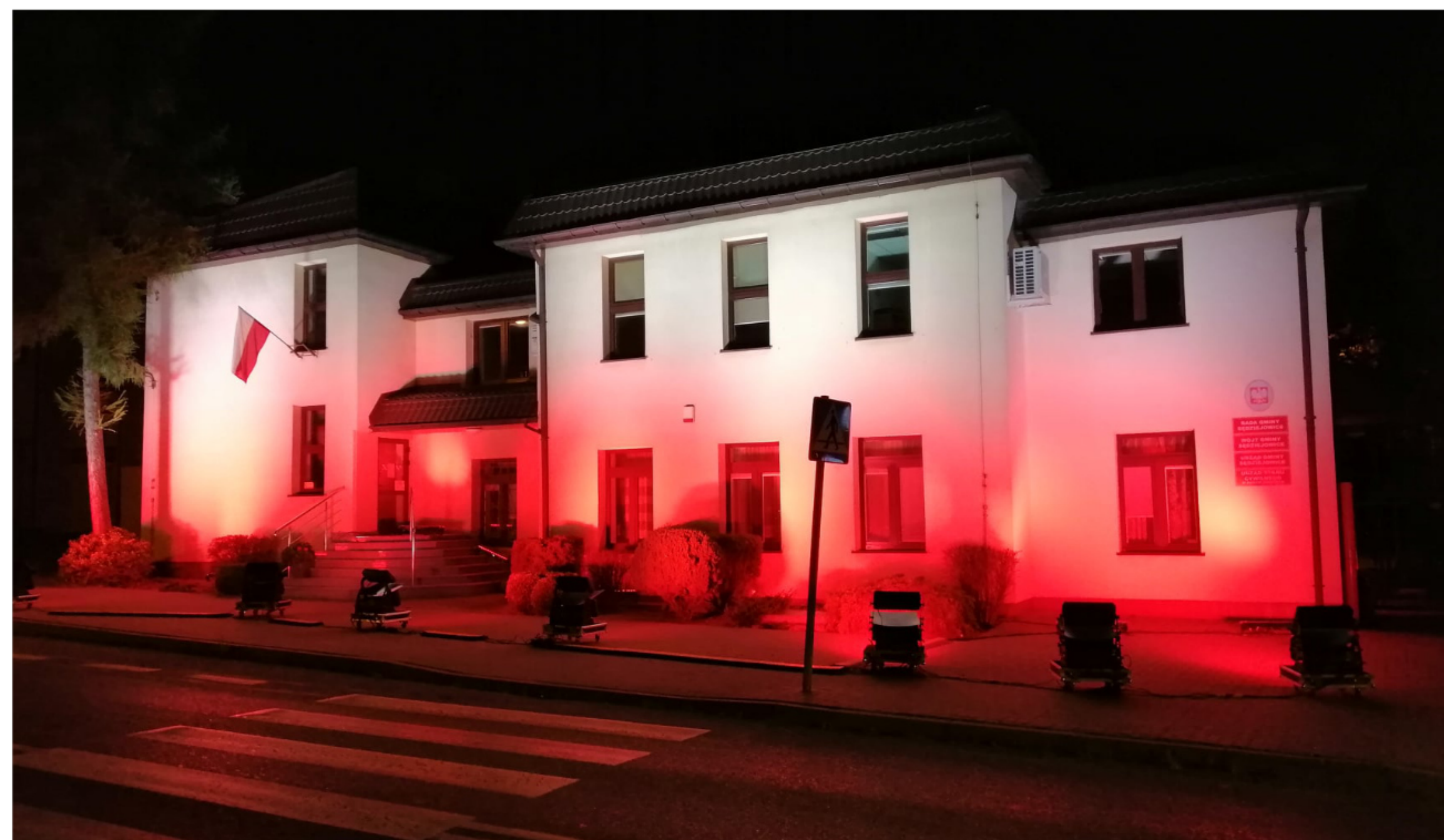
Obchody Święta Niepodległości