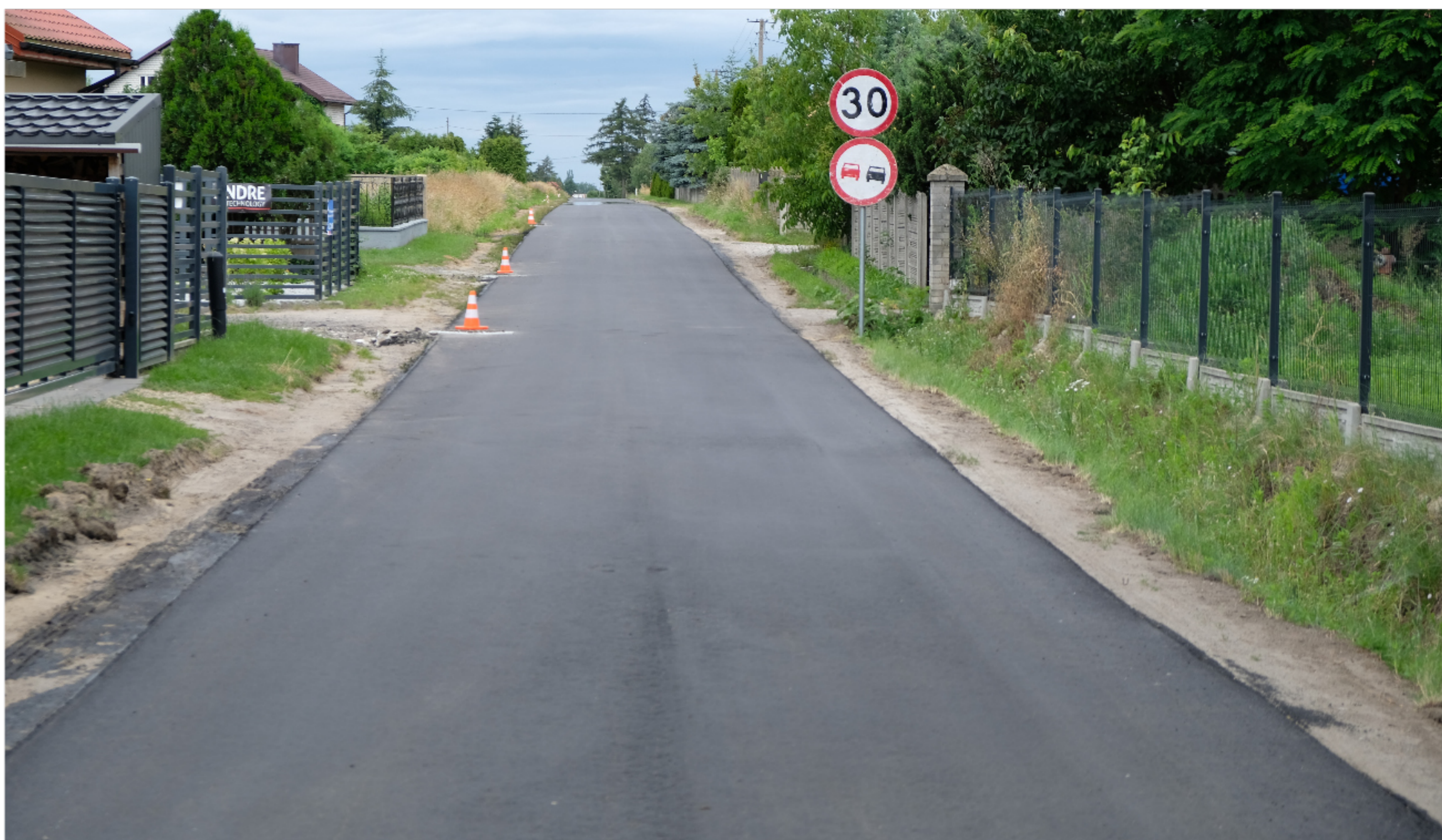
Remont drogi gminnej w Bilewie