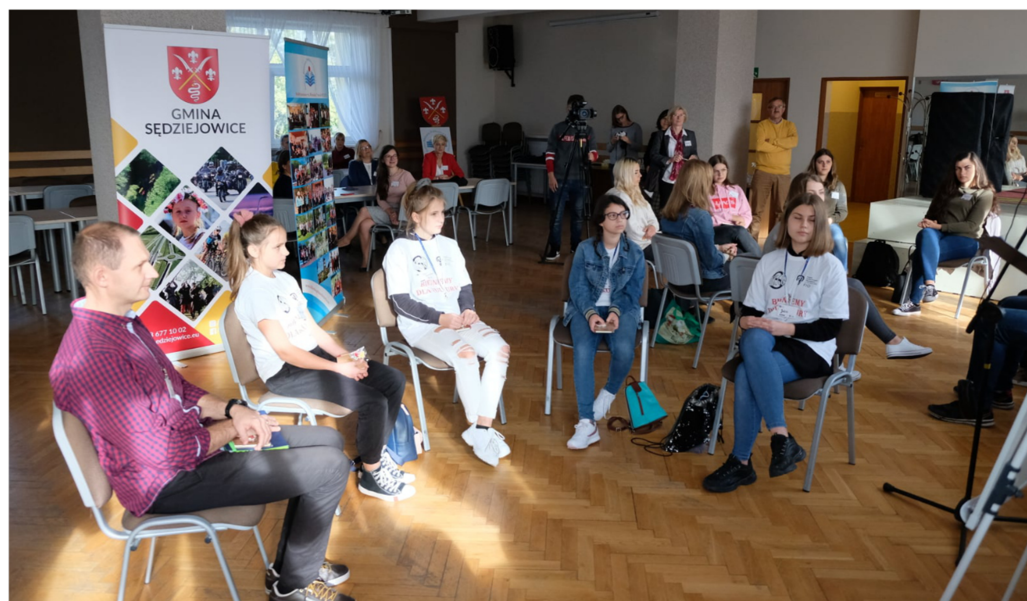
2. Gminne Forum Na Rzecz Młodych