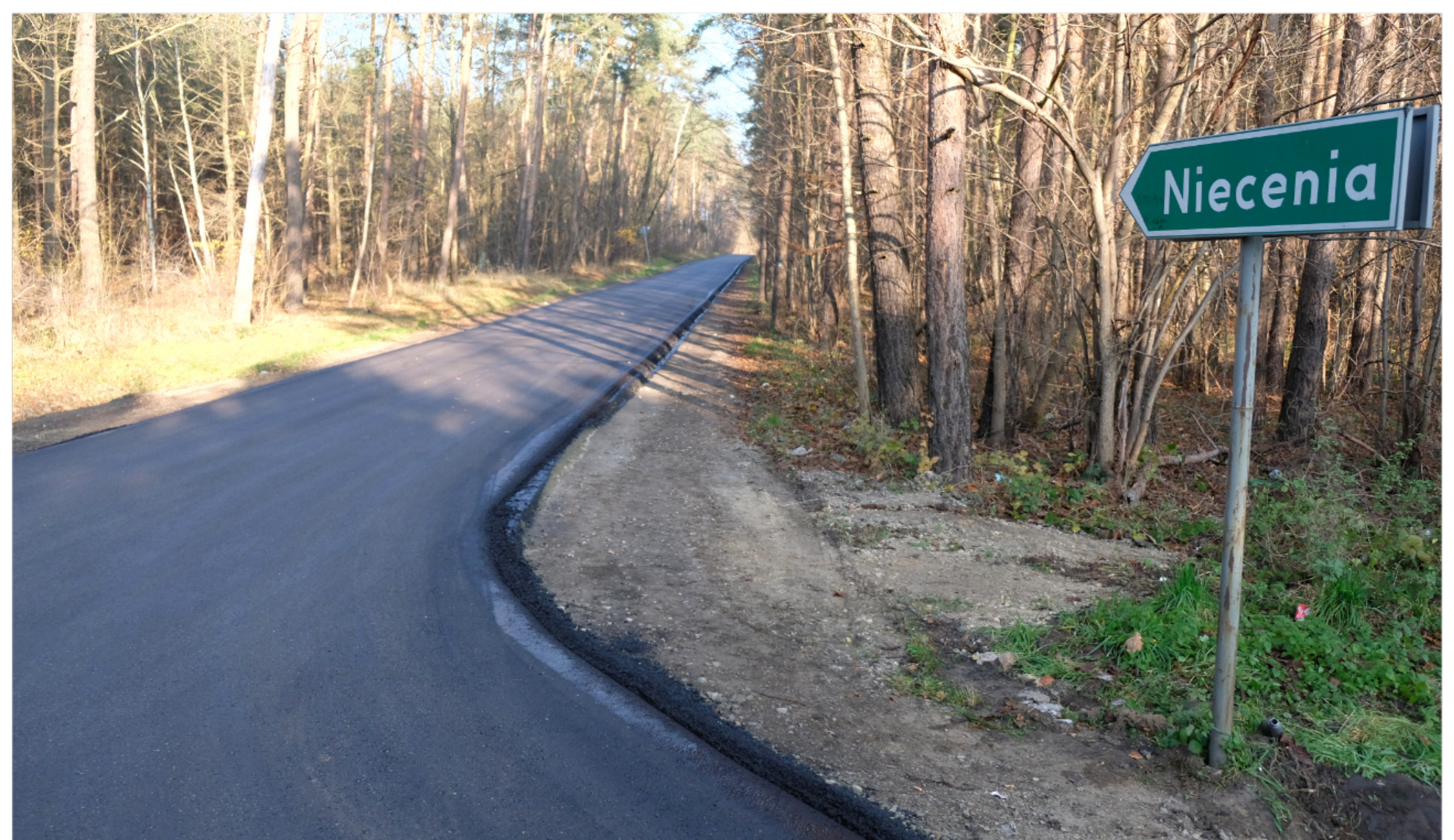
Remont drogi gminnej w Nieceni