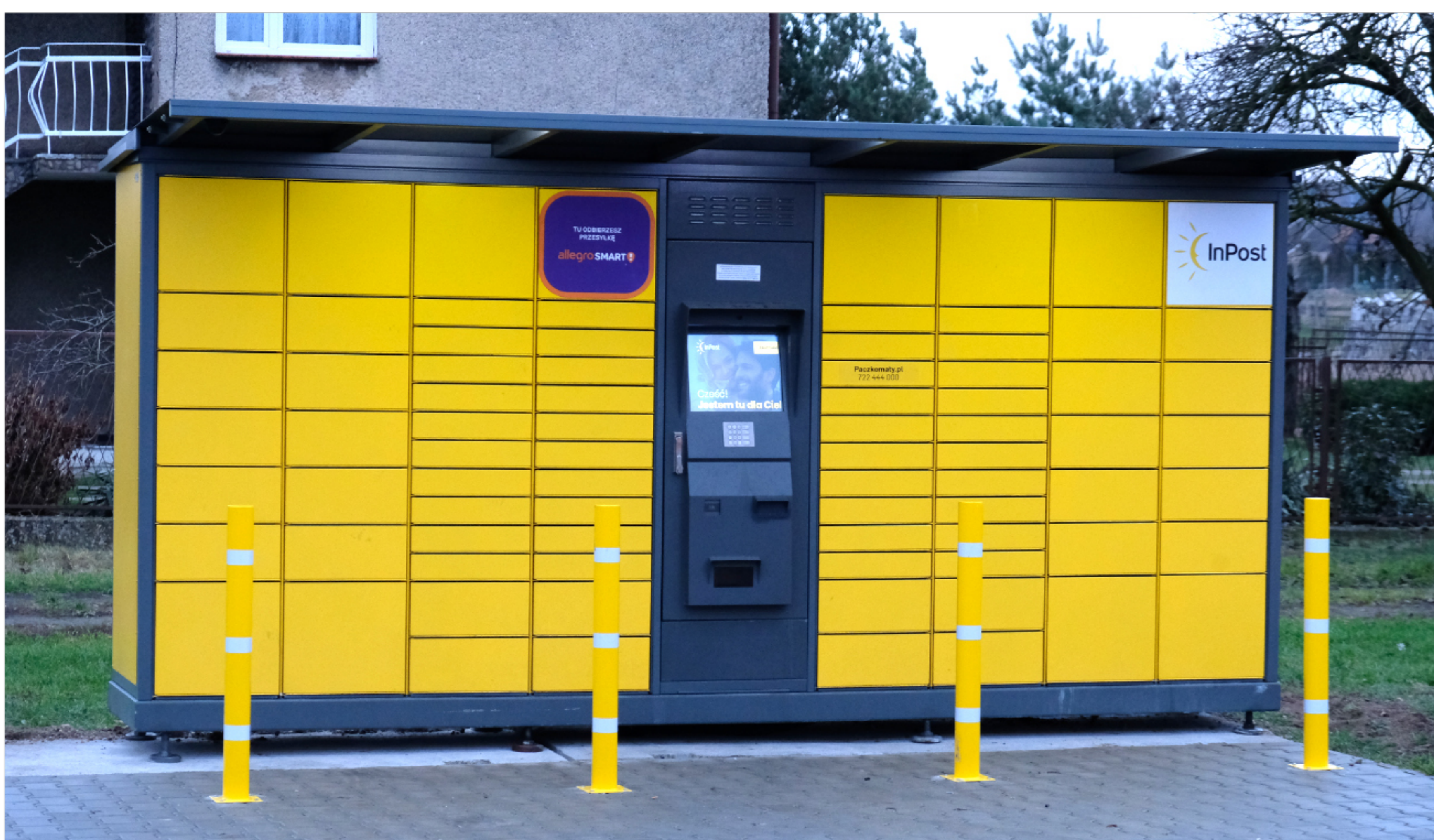
Pierwszy paczkomat w gminie