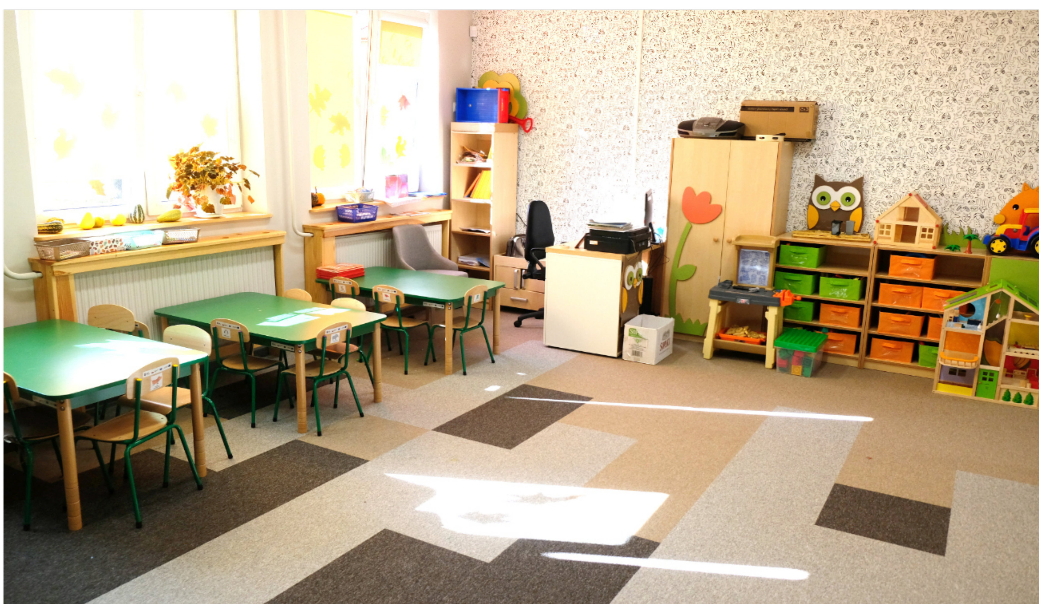
Remonty w przedszkolu w Dobrej