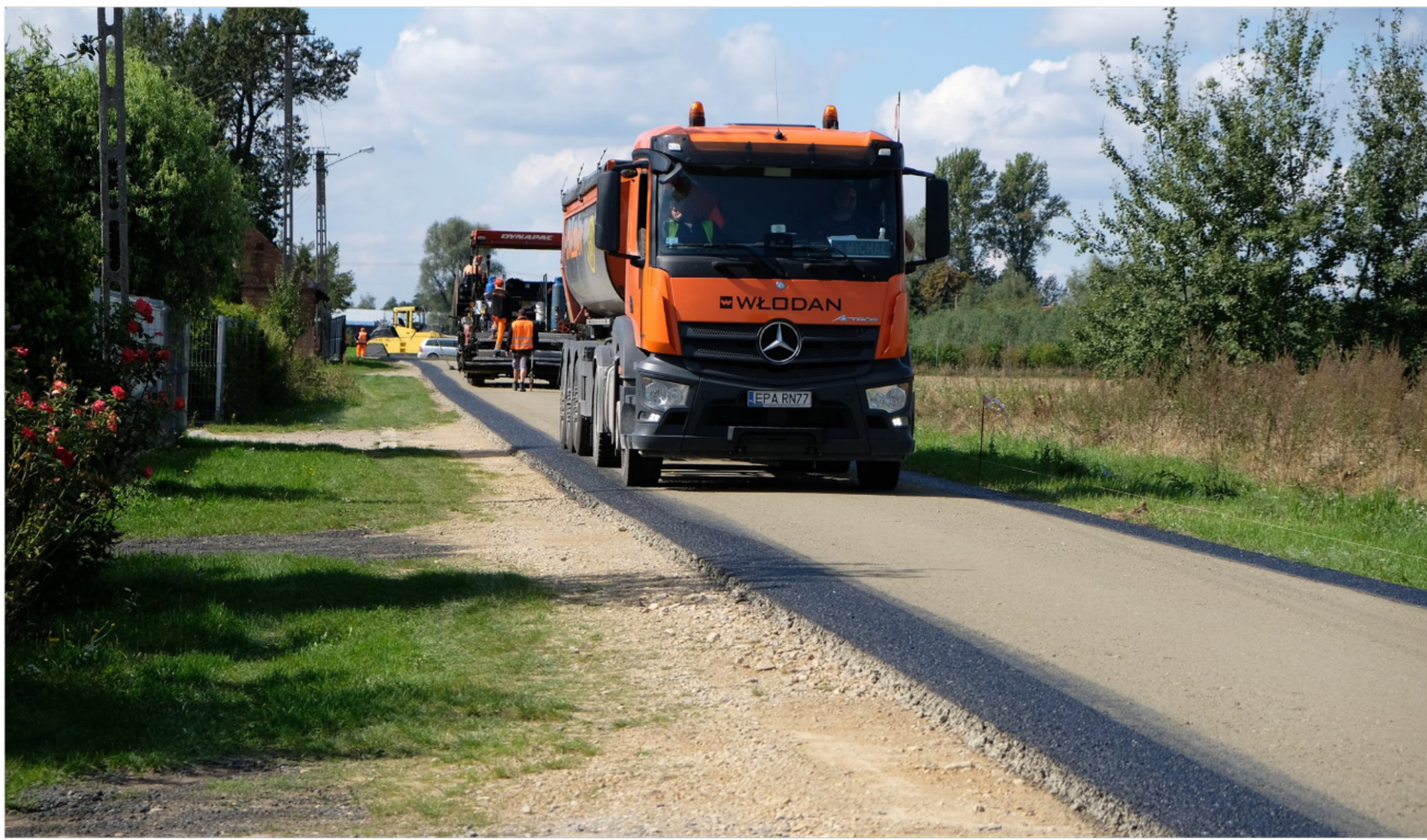
Remont drogi gminnej w Wrzesinach