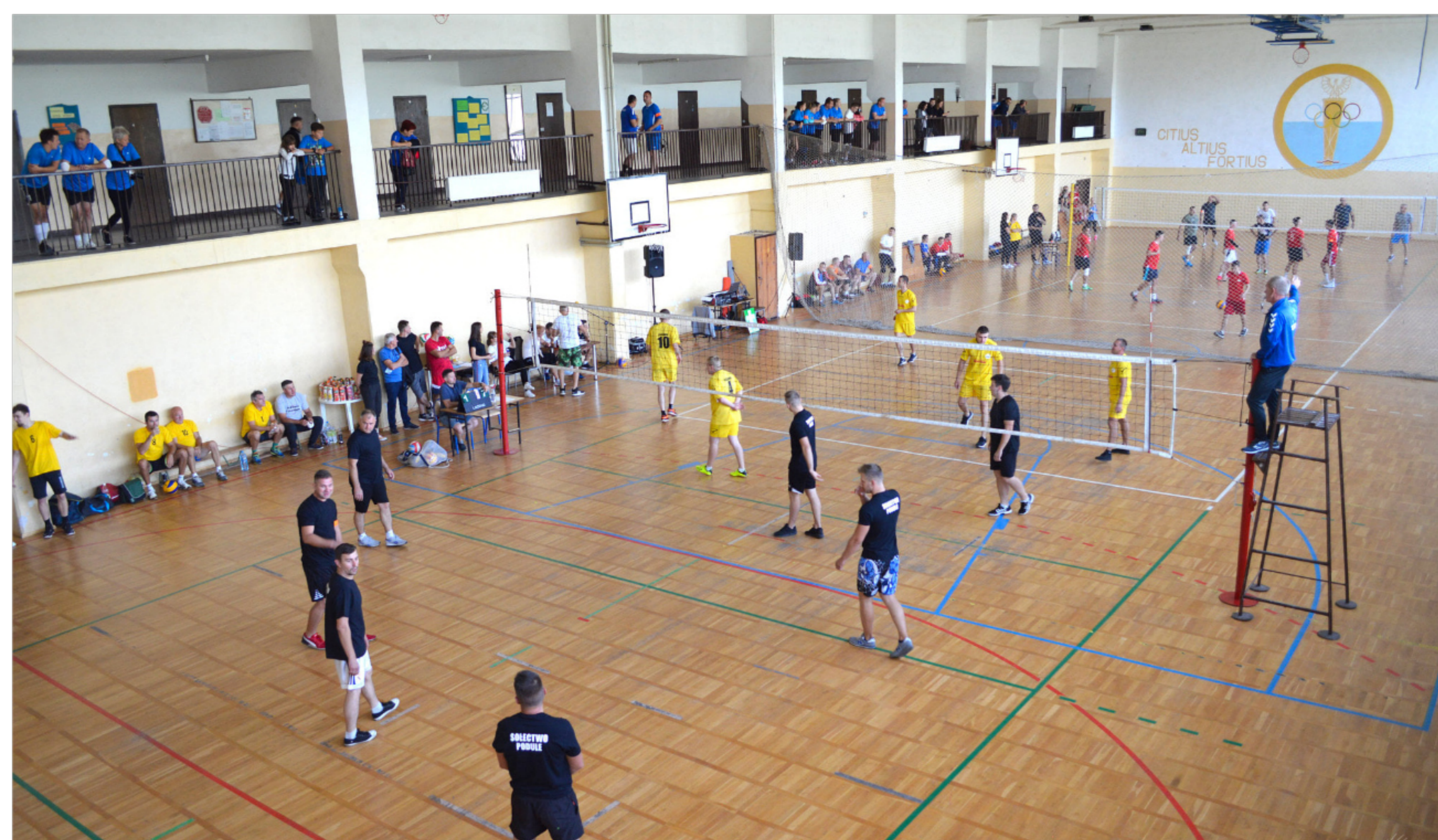
Sołecki turniej piłki siatkowej