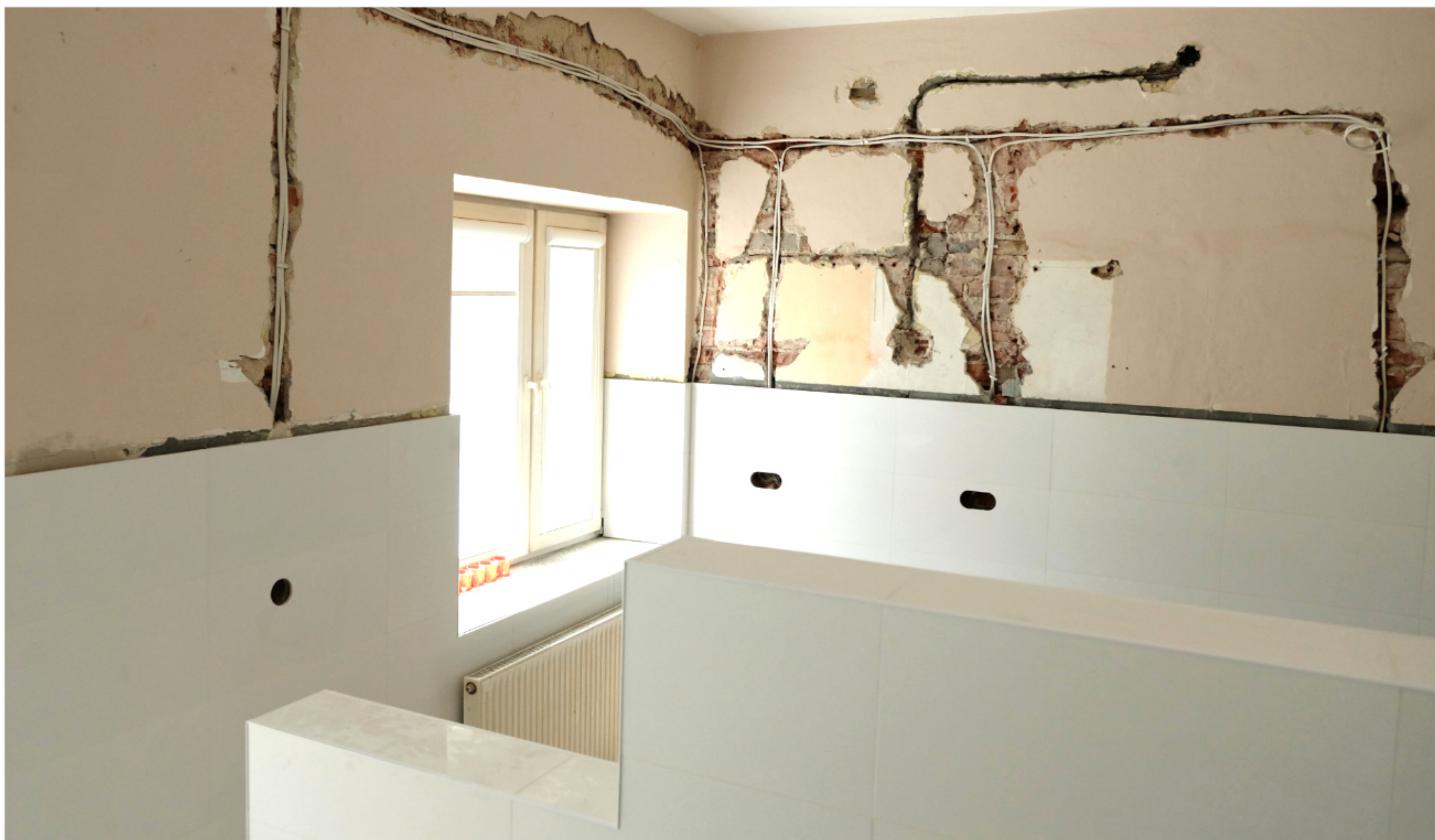
Remonty w ZS w Marzeninie