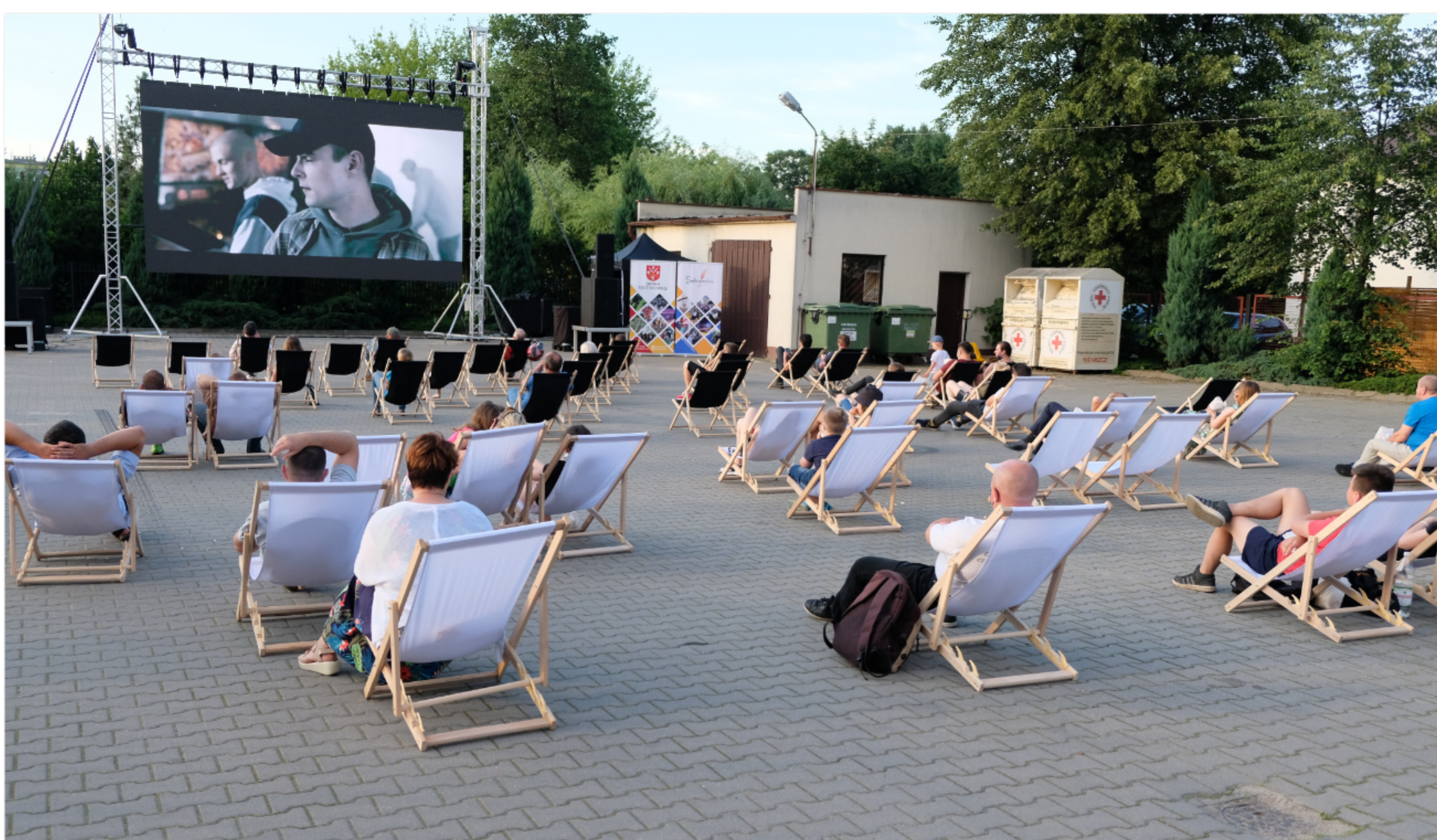
Letnie Kino Plenerowe