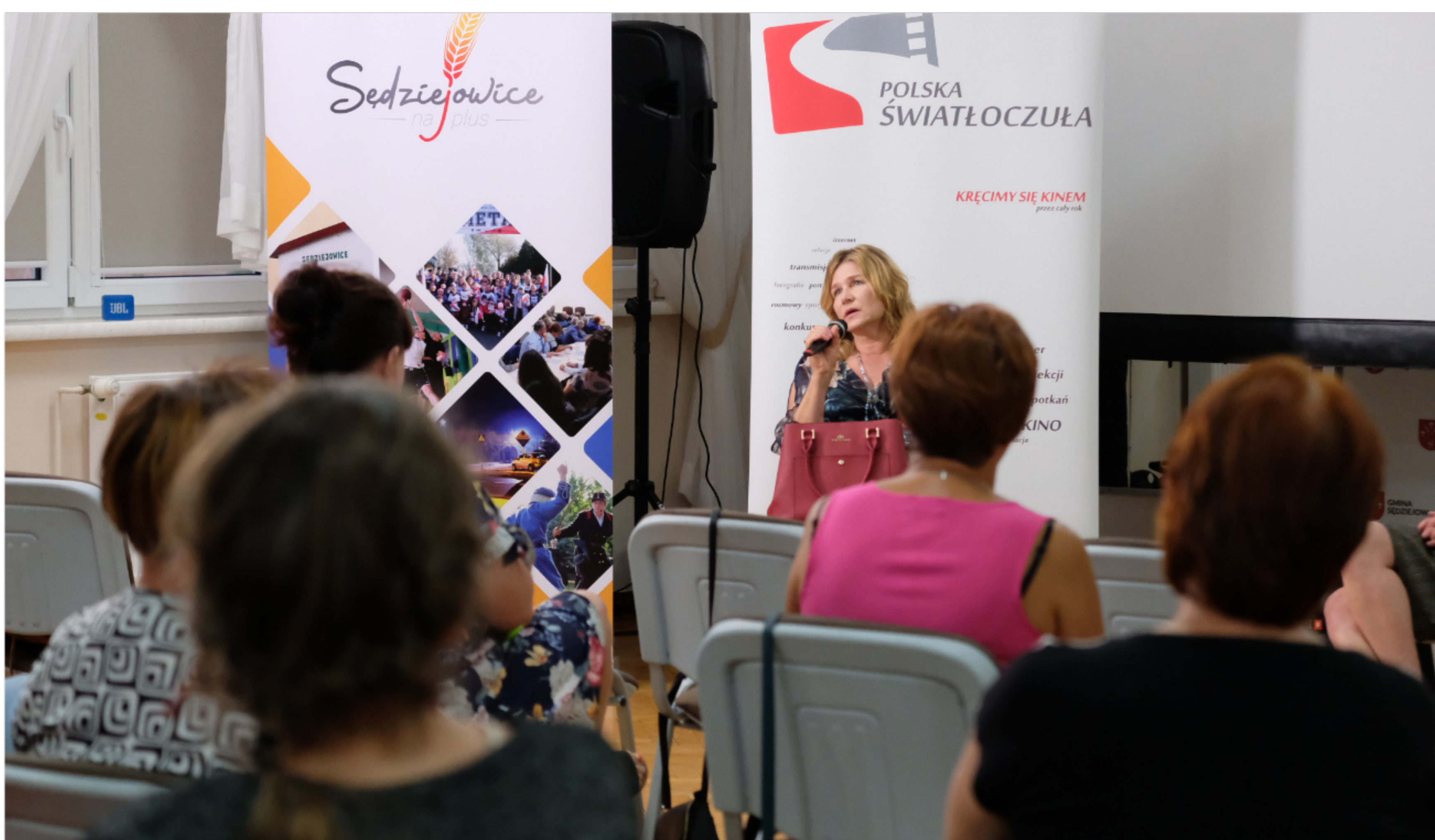
Pokaz filmu "Ułaskawienie"