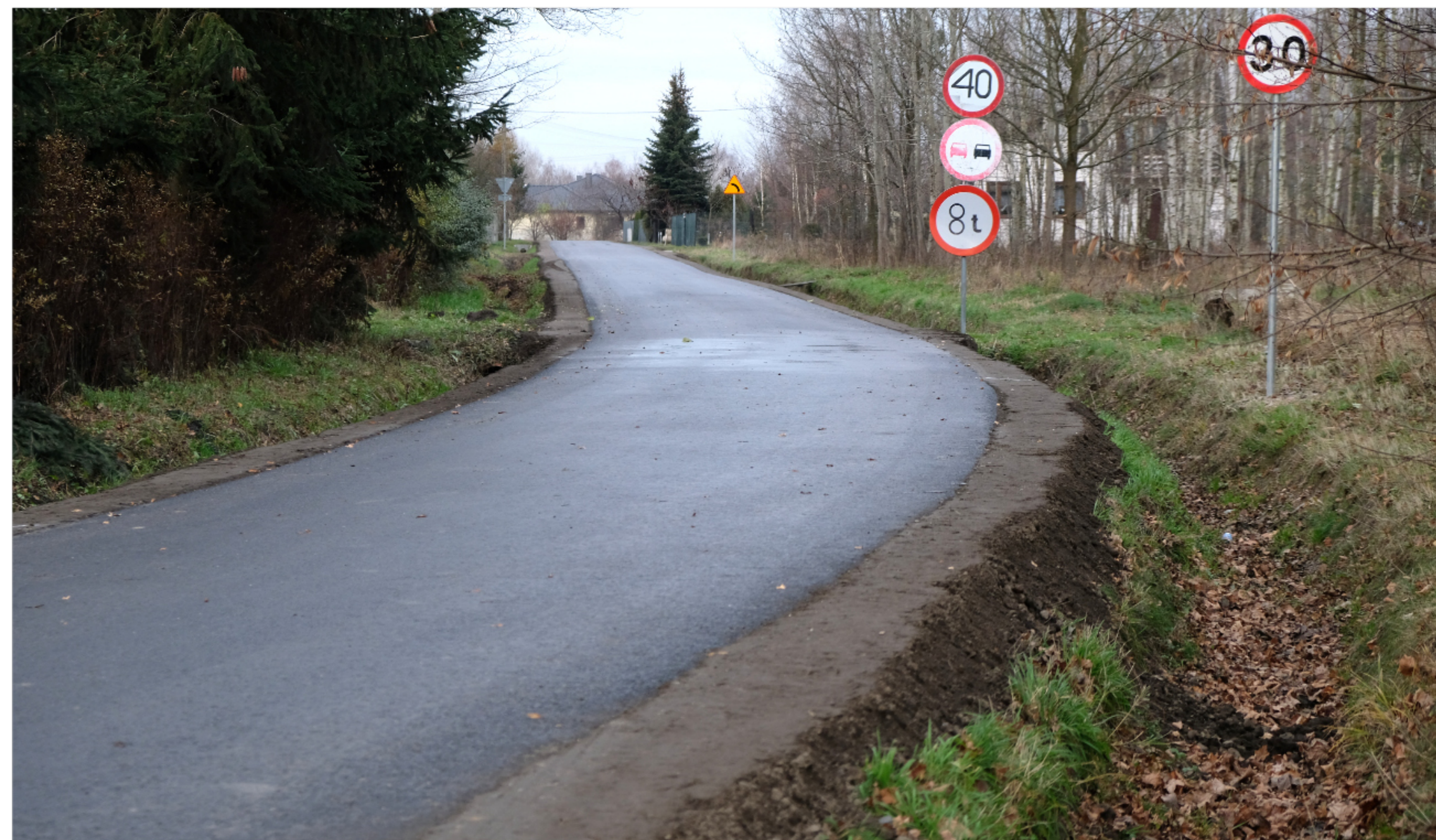
Remont ul. Źródlanej w Pruszkowie