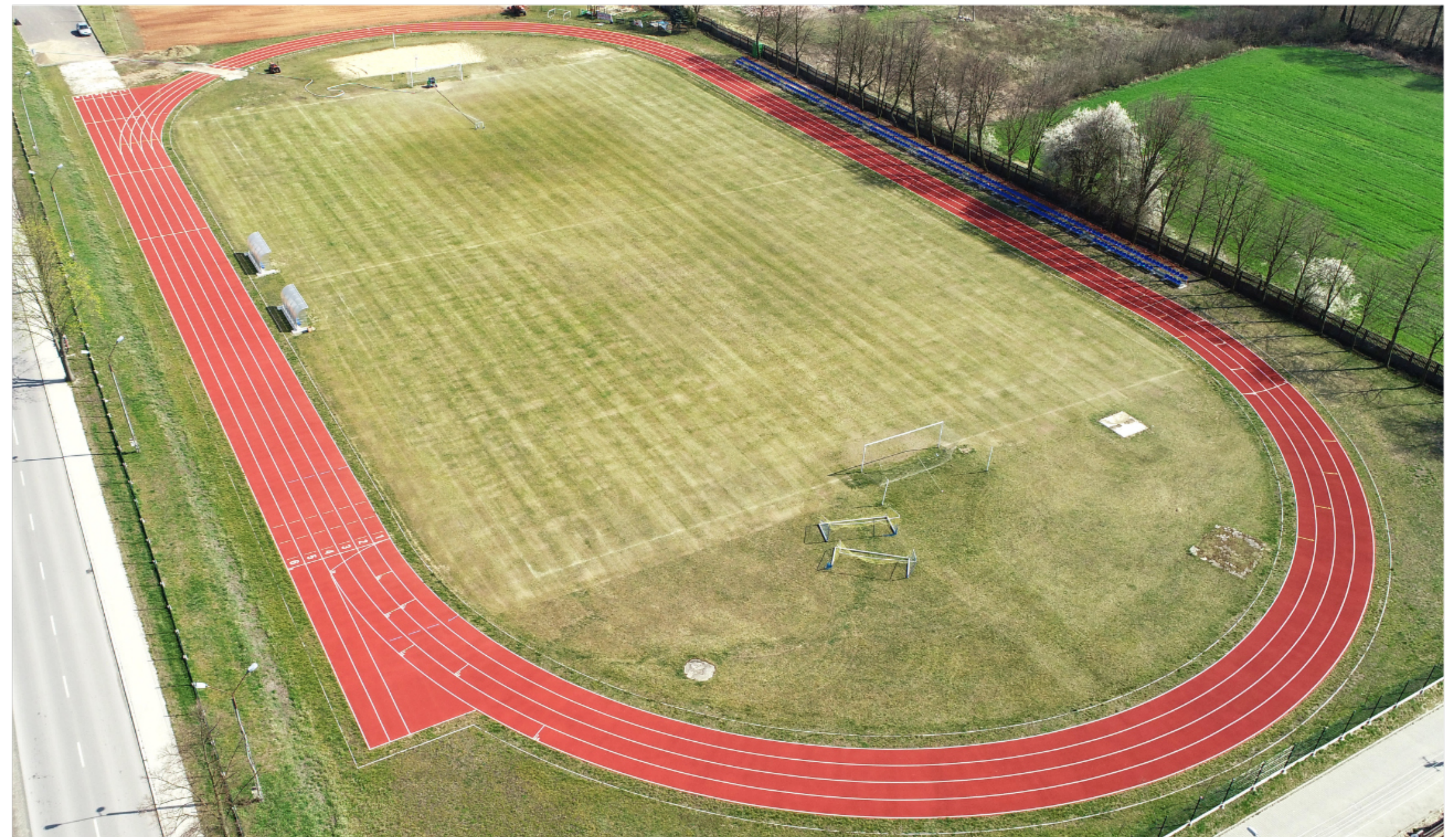
Modernizacja płyty stadionu gminnego